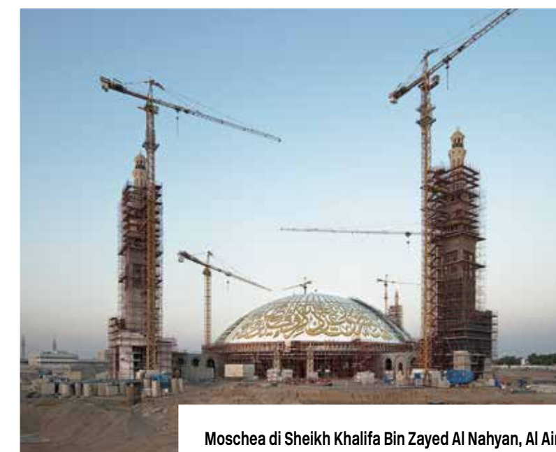
Moschea di Sheikh Khalifa Bin Zayed Al Nahyan, Al Ain, Emirati Arabi Uniti

Studio di progettazione: Bayaty Architects and Engineering Consultancy, Abu Dhabi, UAE. Impresa di costruzioni: Arabian Construction Company, Abu Dhabi, UAE. Impresa di posa: Fantini Mosaici srl, Abu Dhabi, UAE. Sistemi di posa ecocompatibili Kerakoll: la cupola supera gli 80 metri di diametro ed è stata ricoperta da oltre 40 milioni di tessere di mosaico posate con Biogel Extreme e Fugalite Bio, mentre per i minareti è stato usato Superflex Eco.